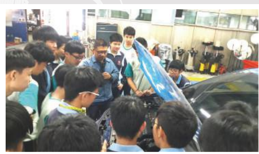
汽車基本結構說明